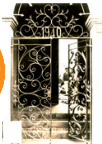
› Entrada del primer centro de Projecte Home Balears.

“Projecte Home Balears atiende, anualmente a un promedio de 1.300 personas, además de sus familias”