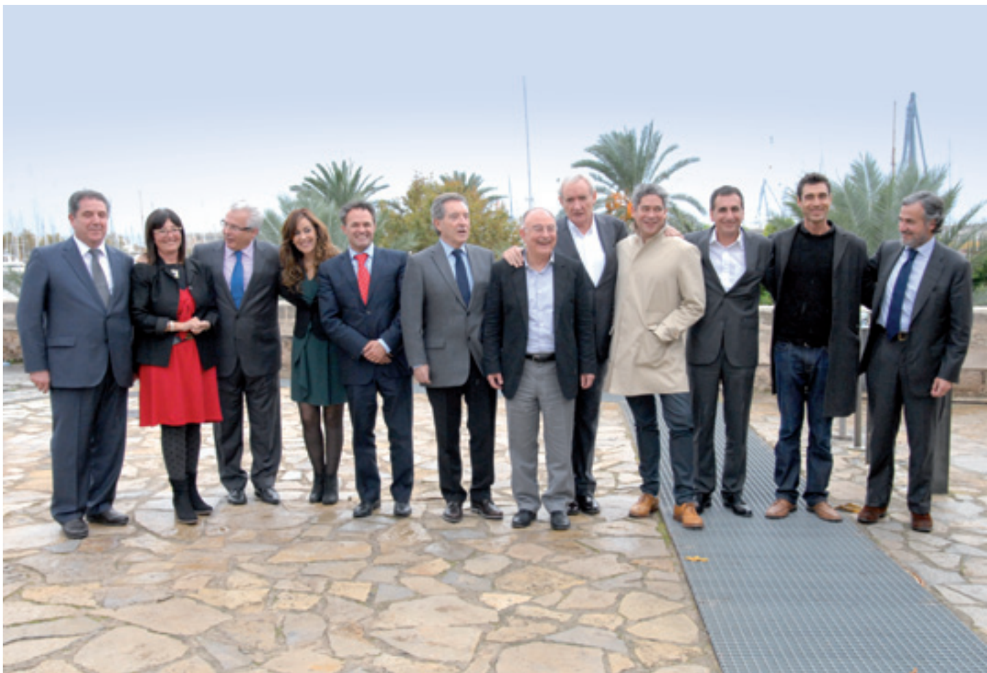
Jornada "Voces para la Vida", que contó con la participación de personalidades del mundo de la cultura, la empresa y la comunicación.