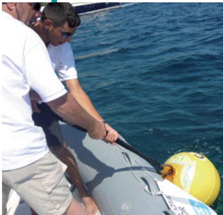
› Potenciamos la inserción laboral de las personas usuarias: en la foto usuarios gestionando las boyas del Cabo de Formentor.

Debido a la geografía de las Islas Baleares, las personas drogodependientes de otros puntos de la isla tenían dificultades para acceder a nuestros programas. Proyecto Hombre Baleares dispone de centros en Menorca e Ibiza. En estos centros se dedican también a la prevención, los programas ambulatorios y las derivaciones a las comunidades terapéuticas en Mallorca, en caso necesario.