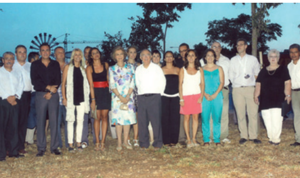
› Visita de la Reina al 25 Aniversario de Projecte Home Balears.

Convocamos a diferentes personalidades conocidas por su creatividad y buen gusto, para que nos decoraran una mesa cada una. La temática de la decoración de las mesas de la cena fue la Navidad. Las mesas fueron decoradas con flores, velas, figuras o árboles de Navidad, pero sobre todo con ilusión, con mucha ilusión. Quisimos que cada mesa fuera un sueño, una manera diferente de transmitir la fiesta más entrañable del año, y lo conseguimos. Gracias a todos de nuevo.