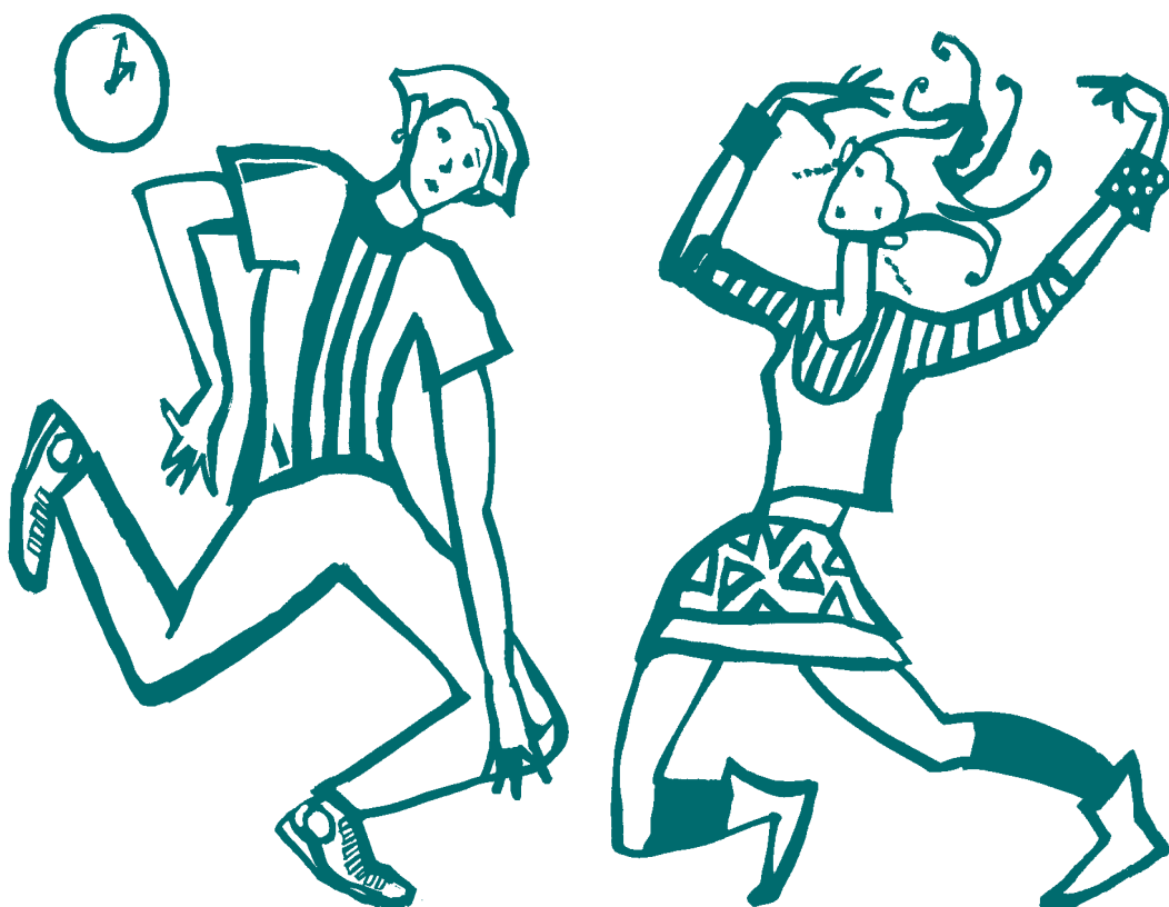
ILUSTRACIONES: Asun Balzola

Programas de prevención, evaluación de programas de prevención, bebidas alcohólicas, tabaco, conductas prosociales.